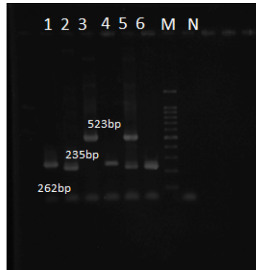
تصویر شماره ۱: تصویر الکتروفورس ژن‌های تکثیر شده روی ژل آگارز M: مارکر ۱۰۰ BP، ۱ و ۲ و ۳ کنترل‌های مثبت، N: کنترل منفی، ۵: نمونه‌های مثبت بیماران

تحقیق نشان داد که میزان رشد و تشخیص باکتری‌های سخت رشد در روش‌های بررسی شده اختلاف معنادار داشته‌اند ( p < 0/05 ). به وسیله روش کشت ۳ ایزوله (۶درصد) آلبیوکوکوس اوتیتیدیس، ۳ ایزوله (۶درصد) هموفیلوس آنفلوانزا و یک ایزوله (۲درصد) موراکسلا کاتارالیس جداسازی شد. بیشترین باکتری شناسایی شده در این مطالعه به وسیله PCR هموفیلوس آنفلوانزا با ۲۸ ایزوله (۵۶درصد) و سپس آلبیوکوکوس اوتیتیدیس با ۲۵ مورد (۵۰درصد) و تعداد موارد شناسایی شده موراکسلا کاتارالیس ۱۱ مورد (۲۲درصد) بود. نتایج به دست آمده نشان می‌دهد که روش Multiplex PCR روشی دقیق‌تر و حساس‌تر برای شناسایی باکتری‌های مورد مطالعه است.